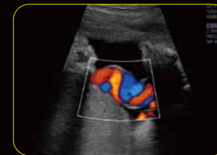
Arteria y vena umbilical